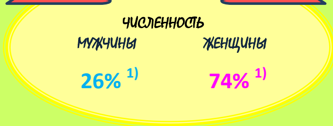
РАСПРЕДЕЛЕНИЕ ЧИСЛЕННОСТИ РАБОТНИКОВ В ЗАВИСИМОСТИ ОТ УСЛОВИЙ РАБОТЫ 1)