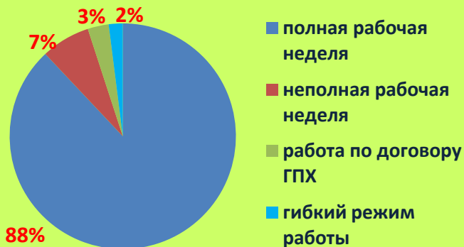
РАСПРЕДЕЛЕНИЕ ЧИСЛЕННОСТИ РАБОТНИКОВ В ЗАВИСИМОСТИ ОТ УСЛОВИЙ РАБОТЫ 1)